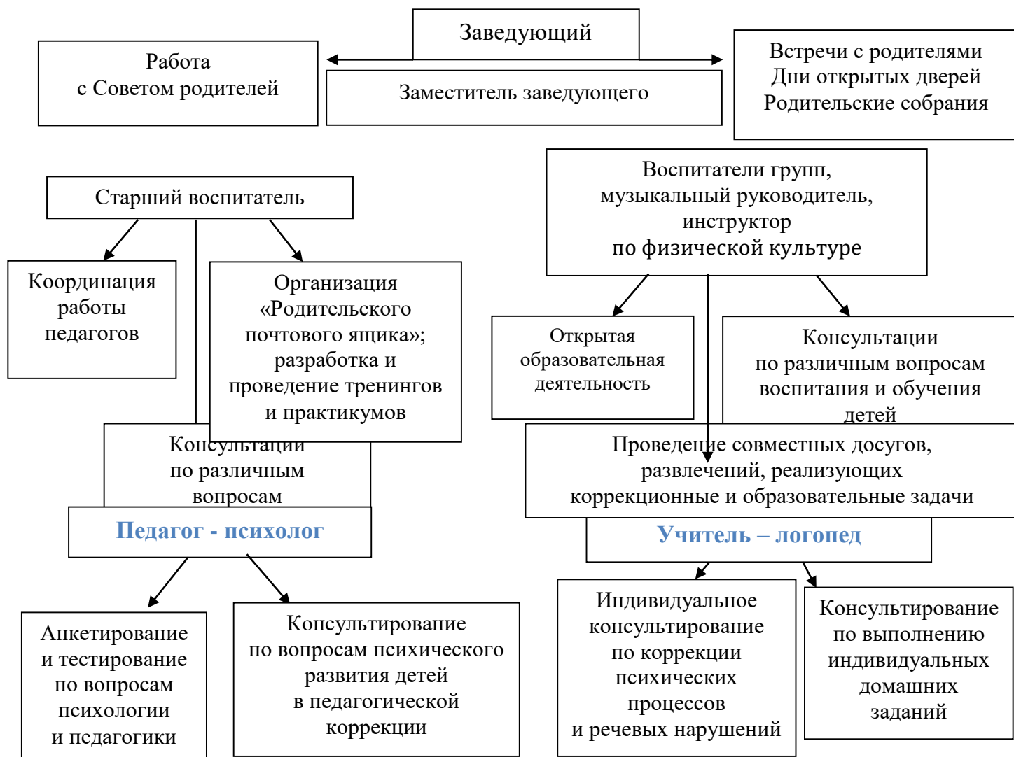
Схема взаимодействия с семьями воспитанников с ТНР